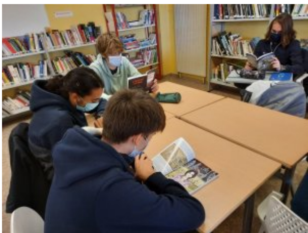
Temps de lecture