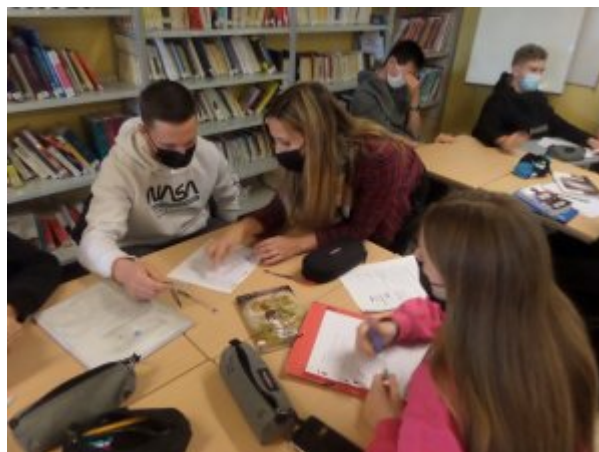
Temps de restitution avec la création de booktrailers