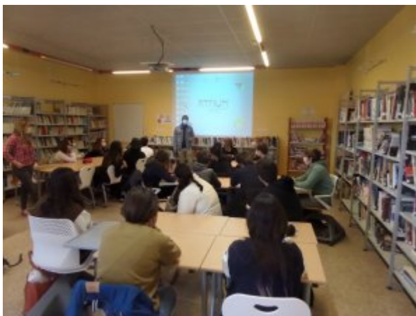
Délibération pour le premier tour