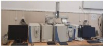
Gas cromatograph (Thermo)

Performing analyzes in the laboratory: analysis of organic compounds (pesticides, pharmaceuticals , aromatic compounds .....)