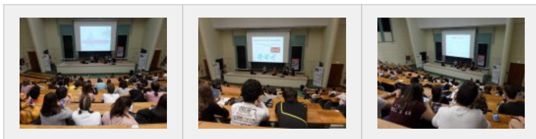
Photo des 550 jeunes qui sont venus présenter leurs travaux et de la première promotion du Lycée Val De Durance.