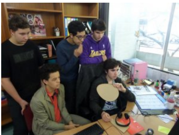
Vidéo-conférence n°2 du 5 décembre 2018