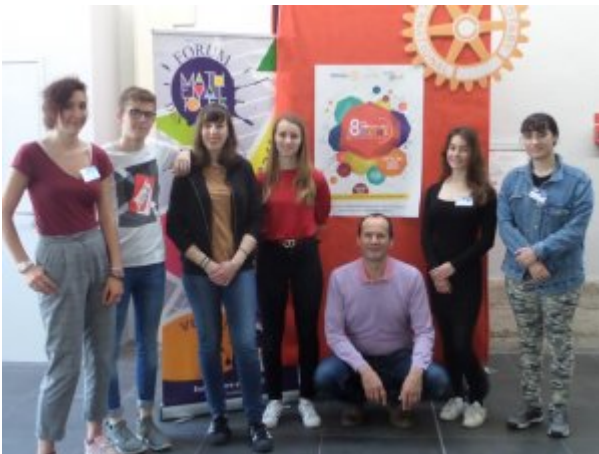
Présentations lors du forum des maths d'Aix-en-Provence