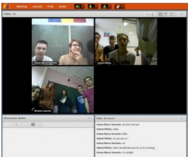
Vidéo-conférence n°1 du 7 novembre 2018