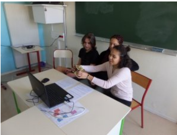
Vidéo-conférence n°5 du 27 février 2019