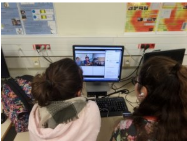
Vidéo-conférence n°3 du 17 décembre 2018