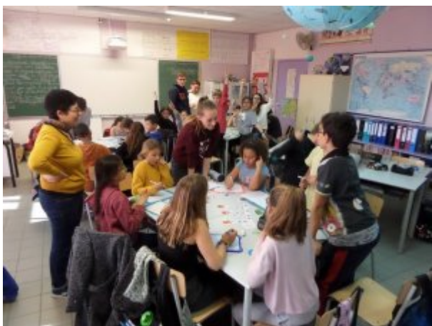
Semaine des maths - Présentations à l'école Pierre Augier