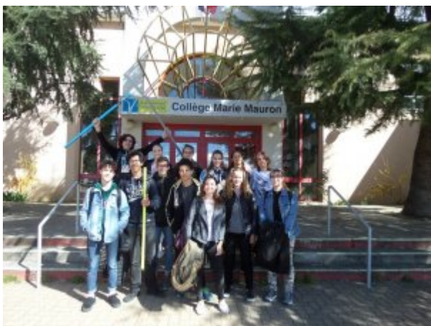
Mauron le 15 mars 2019